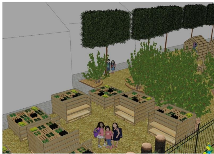
Ontwerp moestuin & modderkeuken Schoolgaard KC Aelse

Wij werken aan een mooie schoolgaard voor uw kinderen, helpt u ook mee?!